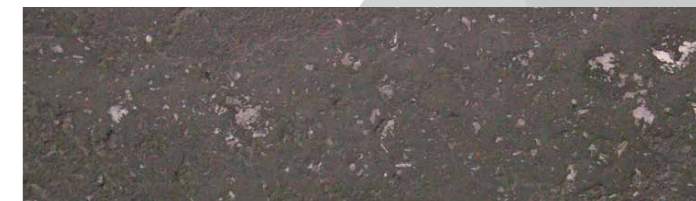
Struktur Venezia / Farbe 121 moorgrau