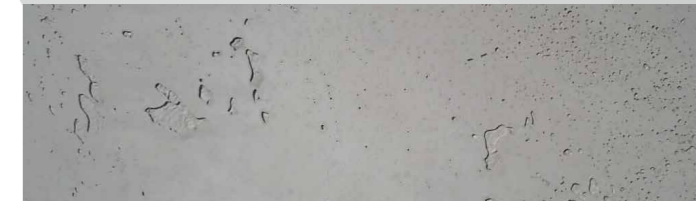
Struktur Betonoptik / Farbe 110 hellgrau