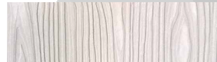
Struktur Holzoptik / Farbe S/173