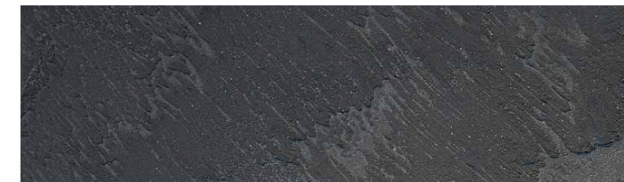
Struktur Schiefer / Farbe 125 graphitgrau