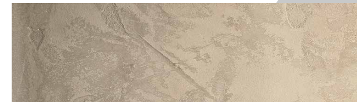
Struktur Emiglia / Farbe S/66