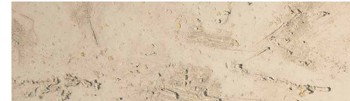
Struktur Toscana / Farbe S/66