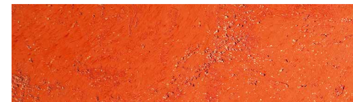
Struktur Bardolino / Farbe 440 feuerrot